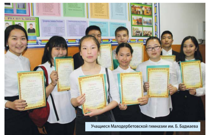
Учащиеся Малодербетовской гимназии им. Б. Бадмаева

года в Черномезельском районе прошел форум молодых педагогов, посвященный Году профсоюзного PR-движения и Году экологии.